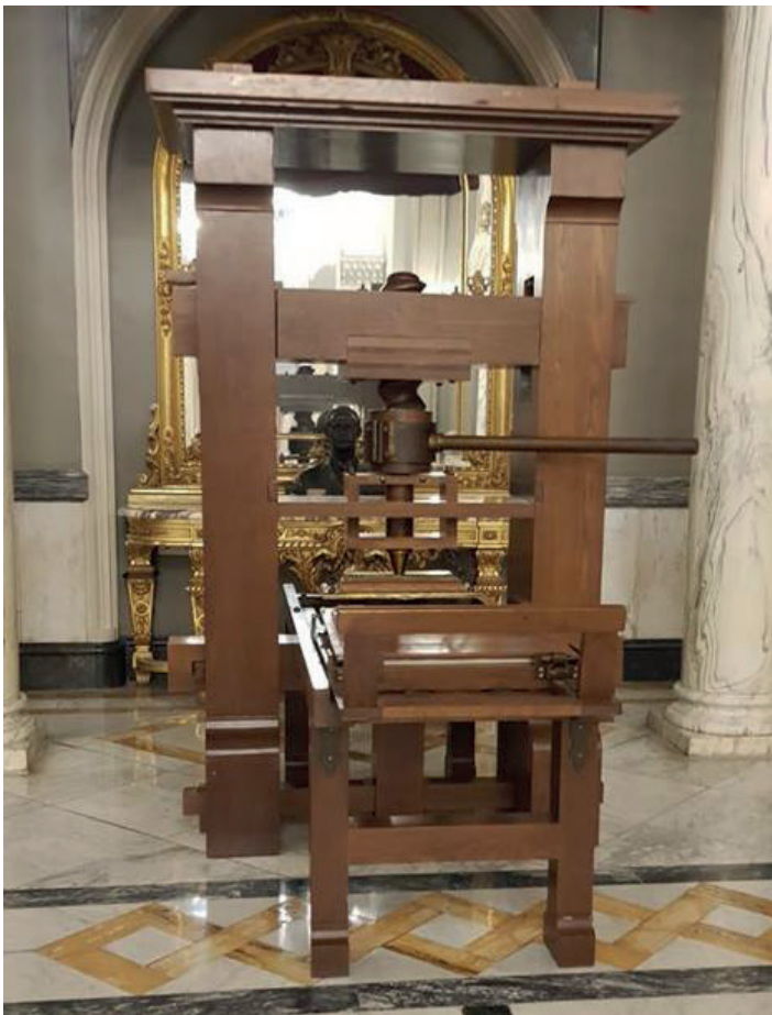
En el Ajuntament de València