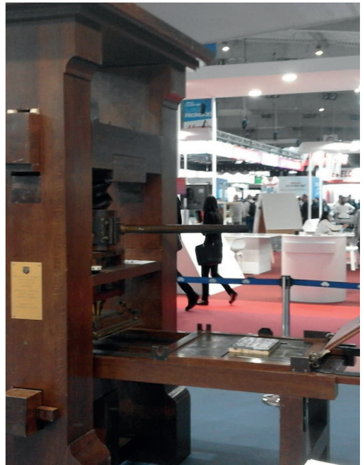
En la Feria de GRAPHISPAG