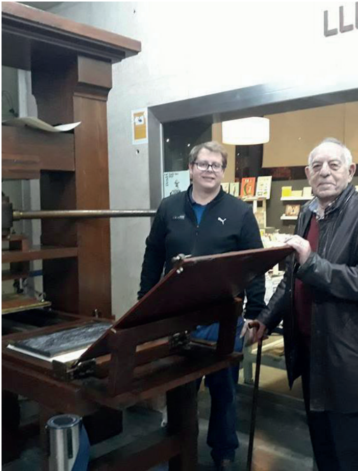
En el MuVIM