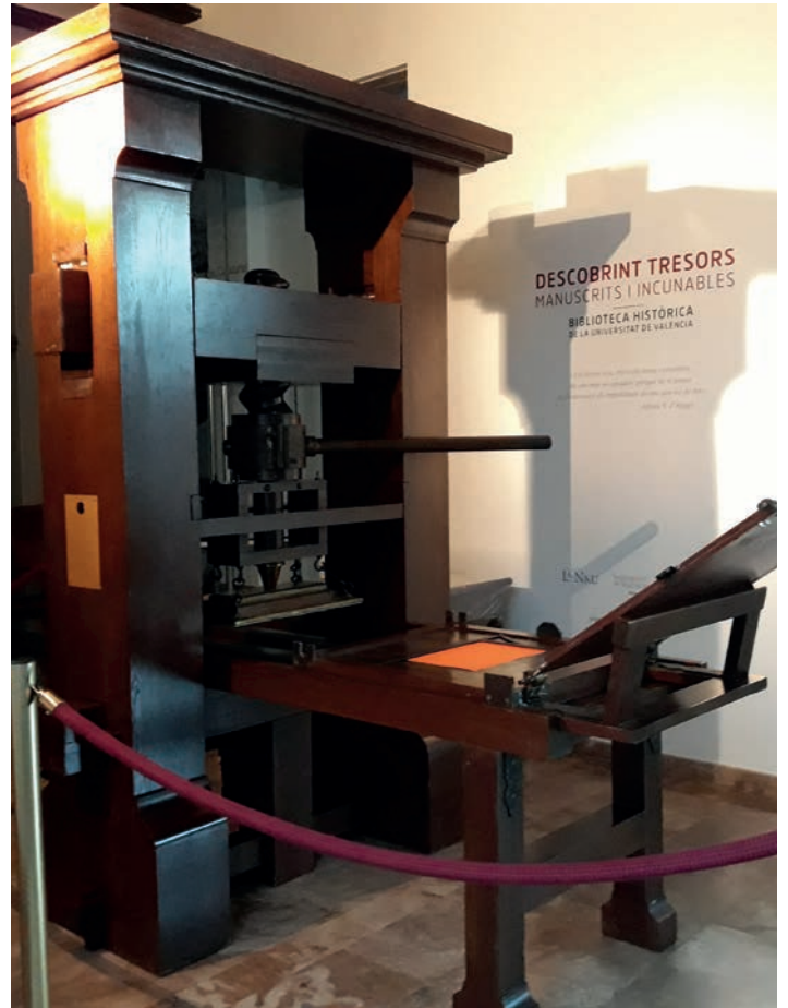
En la Universitat de València